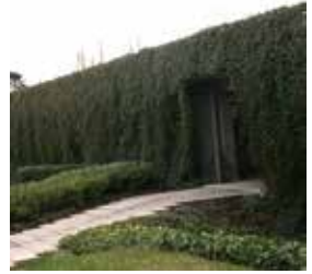
Abords du Parlement Strasbourg - © SB-Eurométropole de Strasbourg