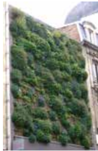
Mur modulaire monobloc Rue de la Veste - Reims