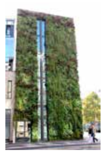
Mur modulaire monobloc de l'École Nationale d'Administration Strasbourg