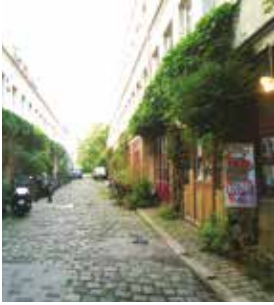
Paris - 11e arrondissement