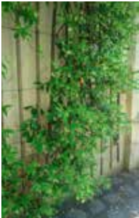
Maison du Jardinage - Paris