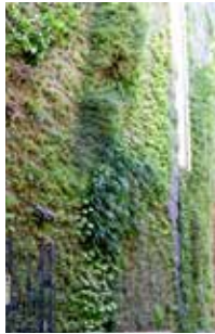
Mur végétal sur mesure Paris